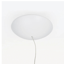
30cm diameter rosette complete with 99W driver