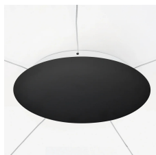
38cm diameter rosette complete with 198W driver