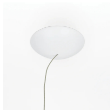
20cm diameter rosette complete with 60W driver