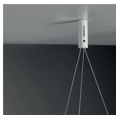
Attacco singolo cavi a soffitto Attacco singolo cavi a soffitto