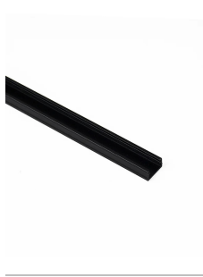
Track cover 24V 1 mt