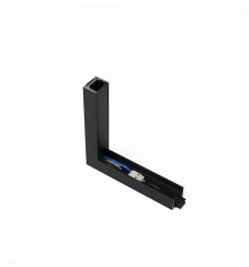
90° wall/ceiling junction length 8.6cm