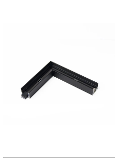
90° joint length 9 x 7.6 cm