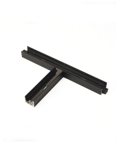
T-junction length 15cm