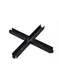
X-junction length 16.5 cm