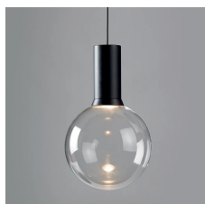
Diffusore in vetro soffiato